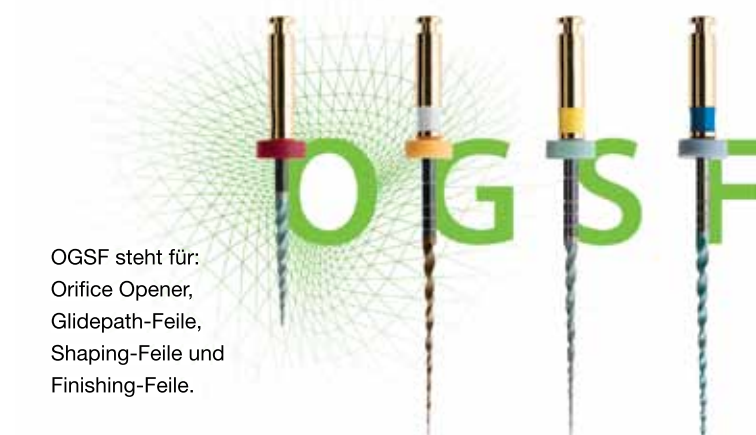
OGSF steht für: Orifice Opener, Glidepath-Feile, Shaping-Feile und Finishing-Feile.

Untersuchungen zeigen, dass durch die Anwendung von Checklisten und die Einhaltung von Standardverfahren die Reproduzierbarkeit und Sicherheit erhöht werden. Basierend auf diesen Erkenntnissen führt COLTENE neue Feilen ein, die nach einem einfachen Proto-